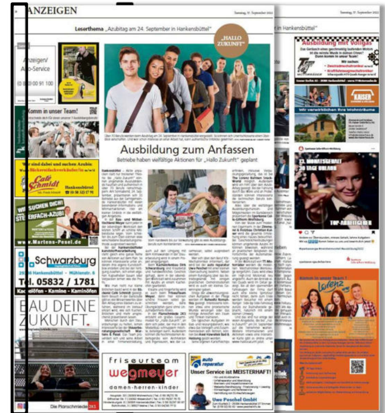
Dargestellt sind die Sonderseiten aus dem Isenhagener Kreisblatt aus 2022